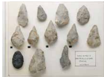
muséum Emmanuel Liais, Cherbourg-en-Cotentin.

Réservation à l'accueil au 02 33 53 51 61 (groupe de 13 personnes maximum).