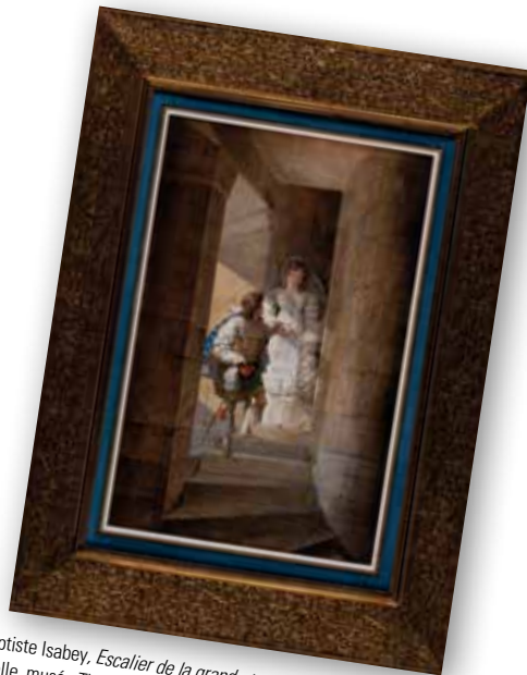
Jean-Baptiste Isabey, Escalier de la grande tour du château d'Harcourt, 1822 , aquarelle, musée Thomas Henry, Cherbourg-en-Cotentin.