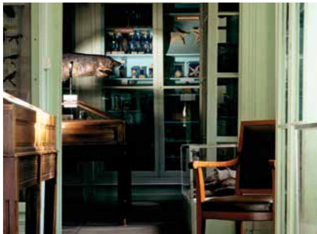
Photo salle Océanographie avec requin, muséum Emmanuel Liais, Cherbourg-en-Cotentin.

Niché dans un écrin de verdure, au cœur du parc Emmanuel Liais, le muséum séduit par son charme délicieusement suranné. Il est resté fidèle à l'esprit des premiers muséums du XIX e siècle et témoigne, par sa muséologie, des conceptions scientifiques de l'époque.