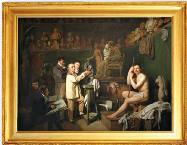
Louis-Léopold Boilly, L'atelier du sculpteur Houdon , vers 1808, Musée Thomas Henry, Cherbourg-en-Cotentin.

La plupart des grands mouvements picturaux européens sont en effet représentés, ordonnés géographiquement sur deux niveaux. Tandis que le premier est consacré aux peintres italiens, renaissants et baroques, au siècle d'or espagnol, aux paysages, portraits et natures mortes flamandes, le second niveau rassemble la peinture et la sculpture françaises du XVII e au début du XX e siècle, du paysage au portrait en passant par les scènes de genre, les tableaux d'histoire ou les peintures de marine... Le musée se distingue également par son remarquable fonds d'œuvres de Jean-François Millet, le deuxième en France après celui du musée d'Orsay.