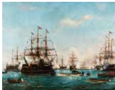
Paul Gallard-Lépinay, Visite des trois présidents à l'escadre française en rade de Cherbourg, en 1880, vers 1880, huile sur toile, Cherbourg-en-Cotentin, musée Thomas Henry © D. Sohier.

Le tableau est visible dans la salle des Marines à l'étage du musée.